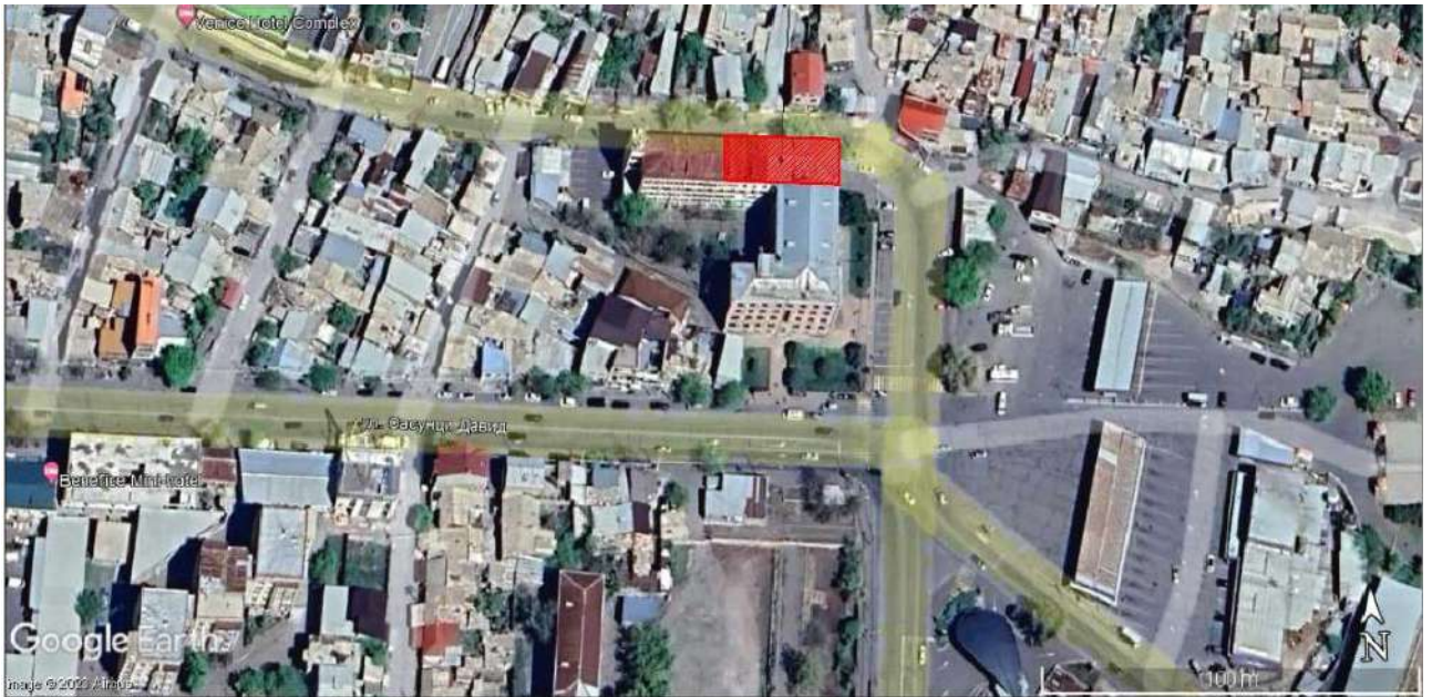
Նկար 3. Քարտեզ և վայրի տեղադիրքը