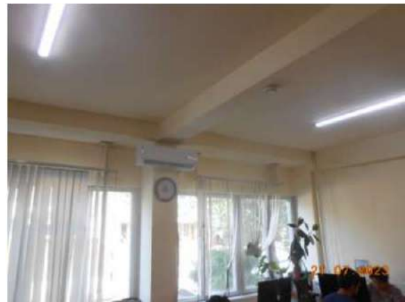
Նկար 4. Շենքի ներքին և արտաքին ներկայիս տեսքը