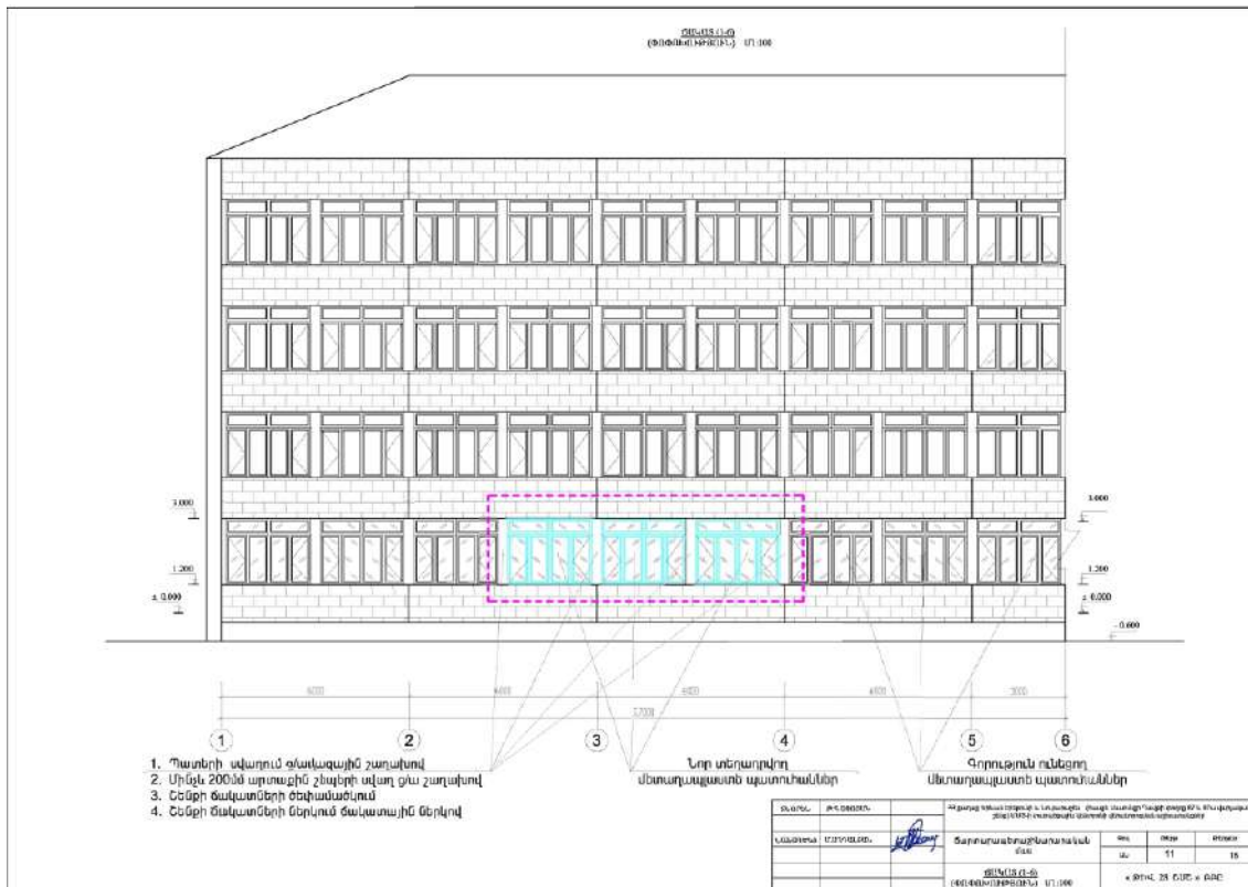
Նկար 2. Շենքի արտաքին տեսքի նախագիծը